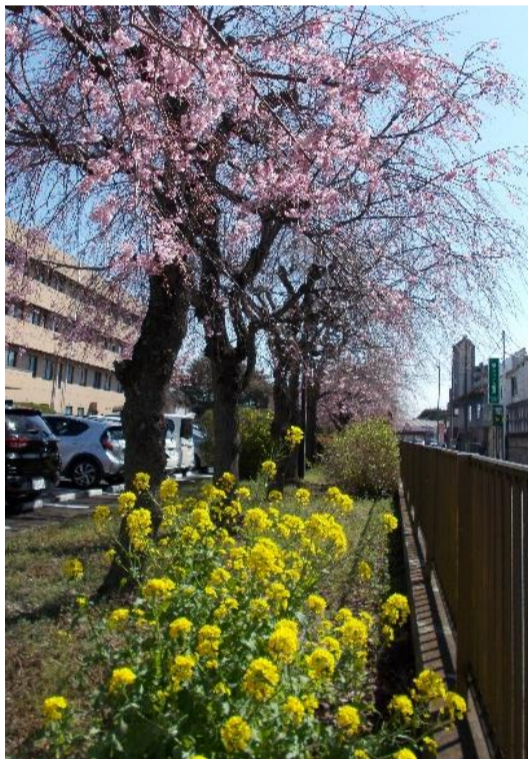
敷地内の桜です 菜の花とのコントラストが素敵ですね