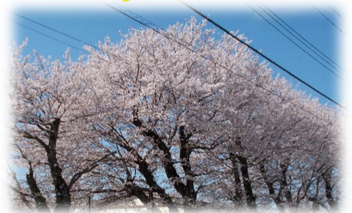
近くの陸上自衛隊駐屯地の桜です 道路沿いにて...